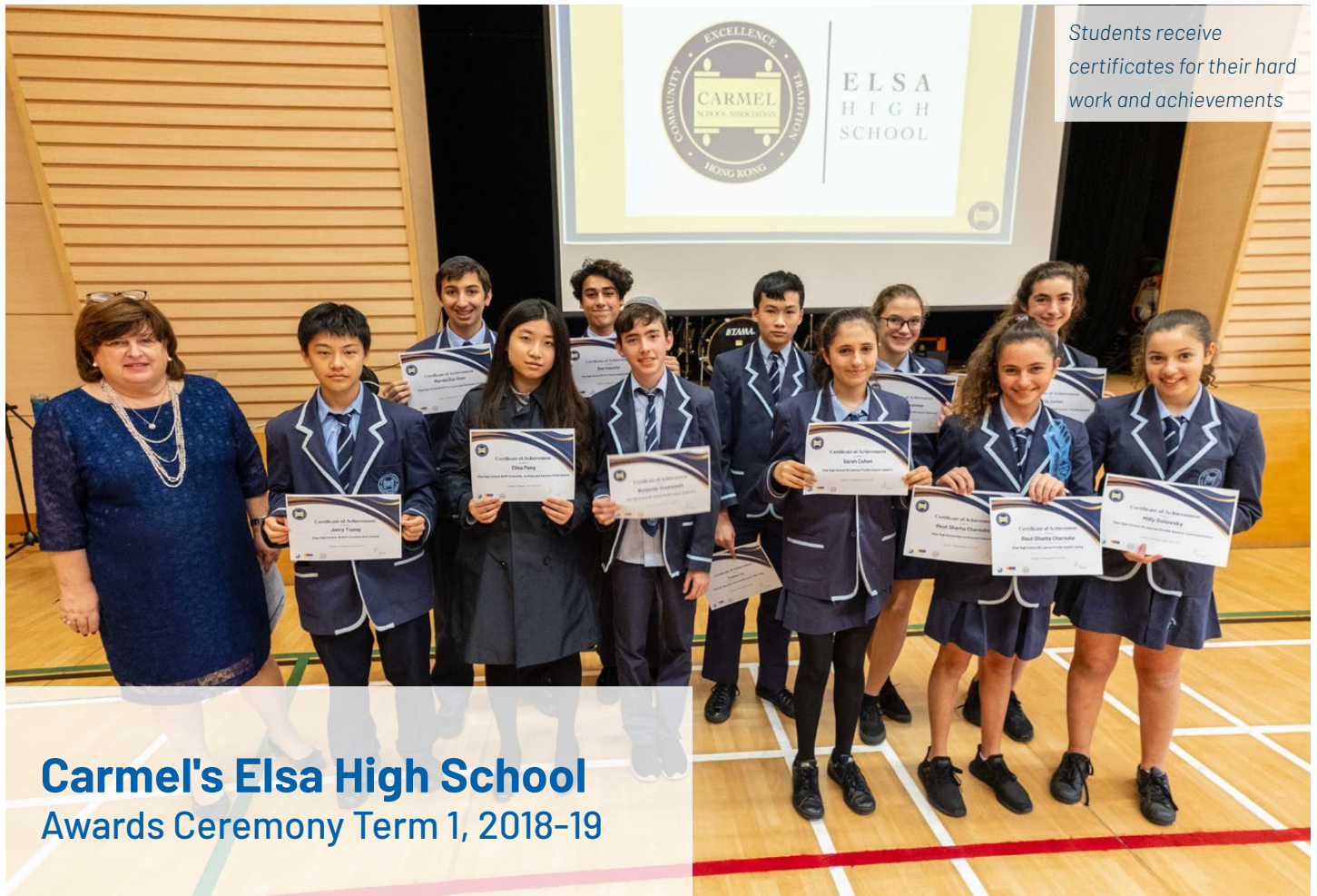
Students receive certificates for their hard work and achievements